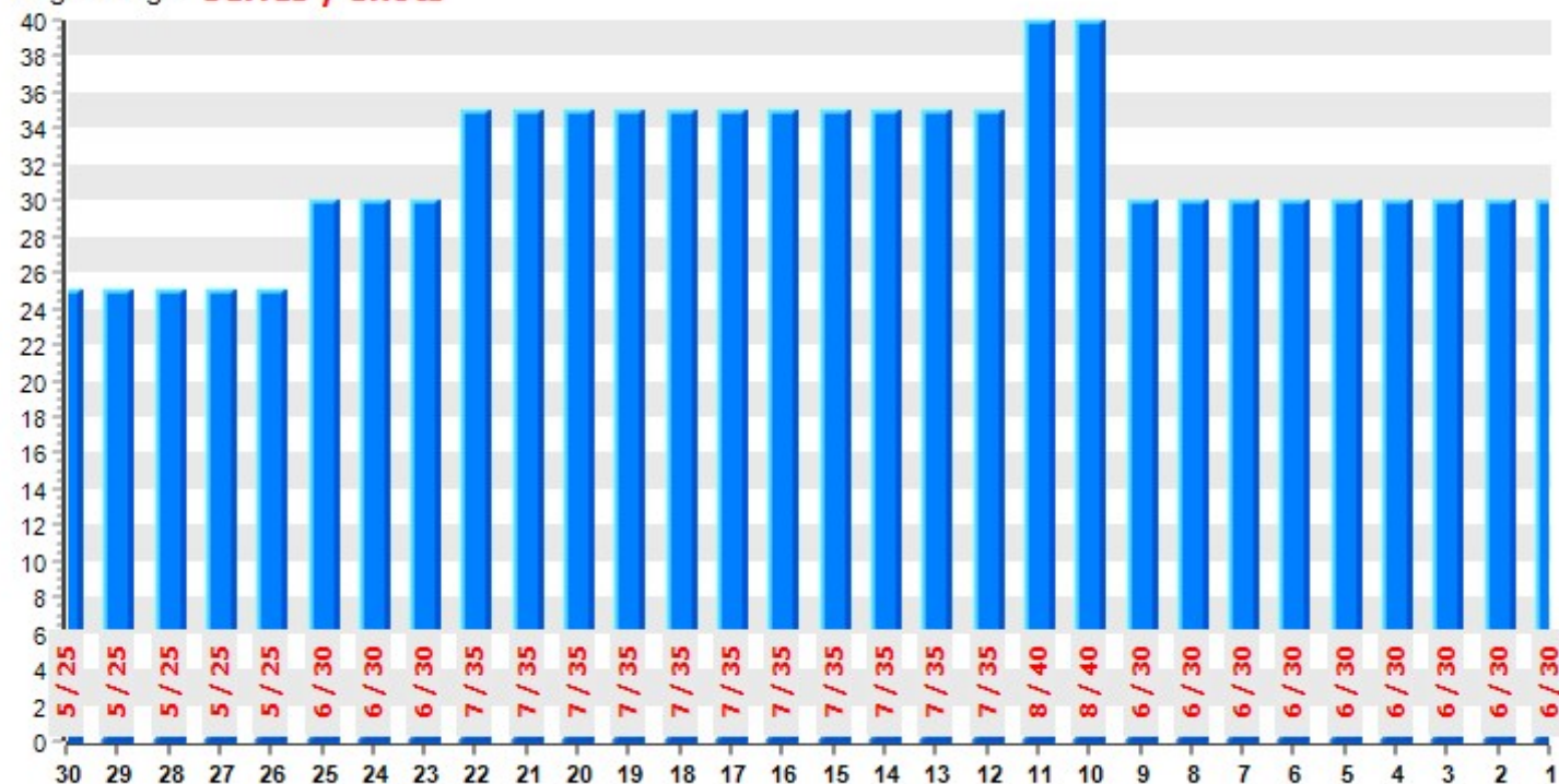
Target usage series / shots

Standing shots recorded: 435, missed shots: 105 => 24,14 %